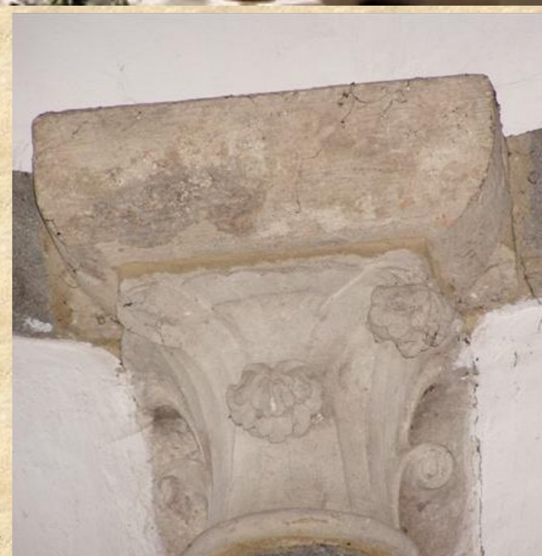
A déli kápolna bimbós oszlopfője