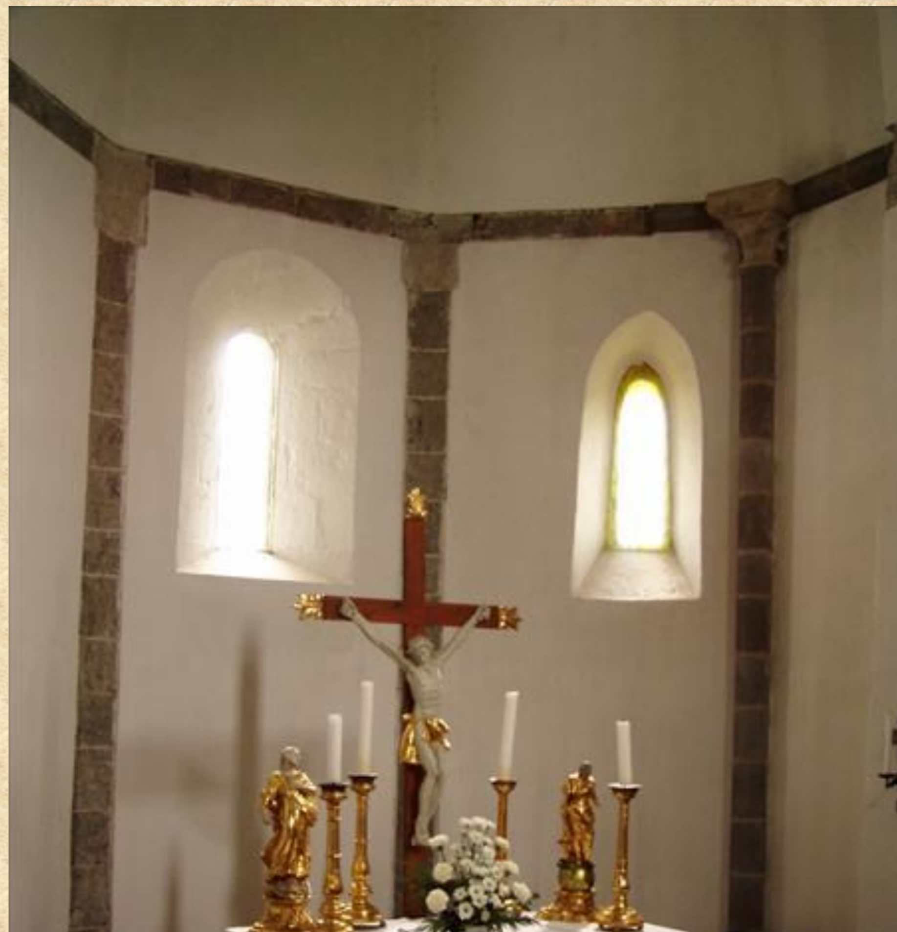
A déli kápolna őrizte meg leginkább az eredeti középkori formákat.