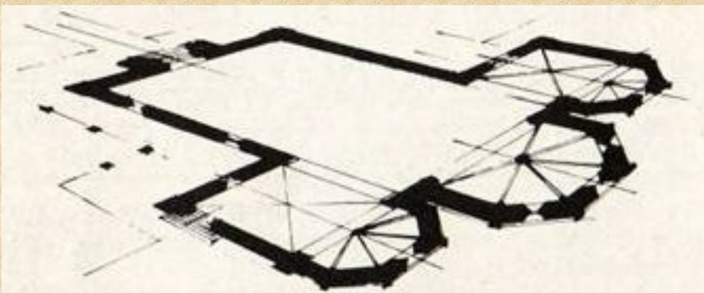
A templom kereszthajós elrendezése újdonságnak számított a hazai román kori építészetben. Ez az alaprajzi elrendezés elsősorban a francia építési gyakorlatra jellemző.