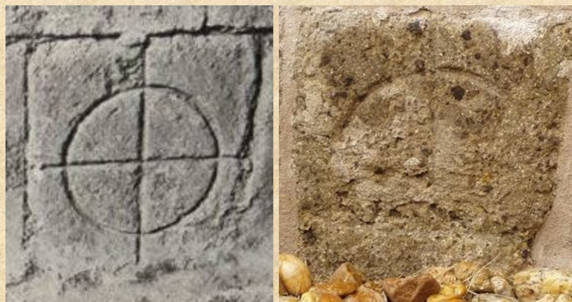
Kőbe vésett névjegy a déli lábazat egyik kővé az 1980-as évek elején és 2010-ben. Valószínűleg az Esztergomból érkezett építőmesterek egyike készítette a munkálatok során.