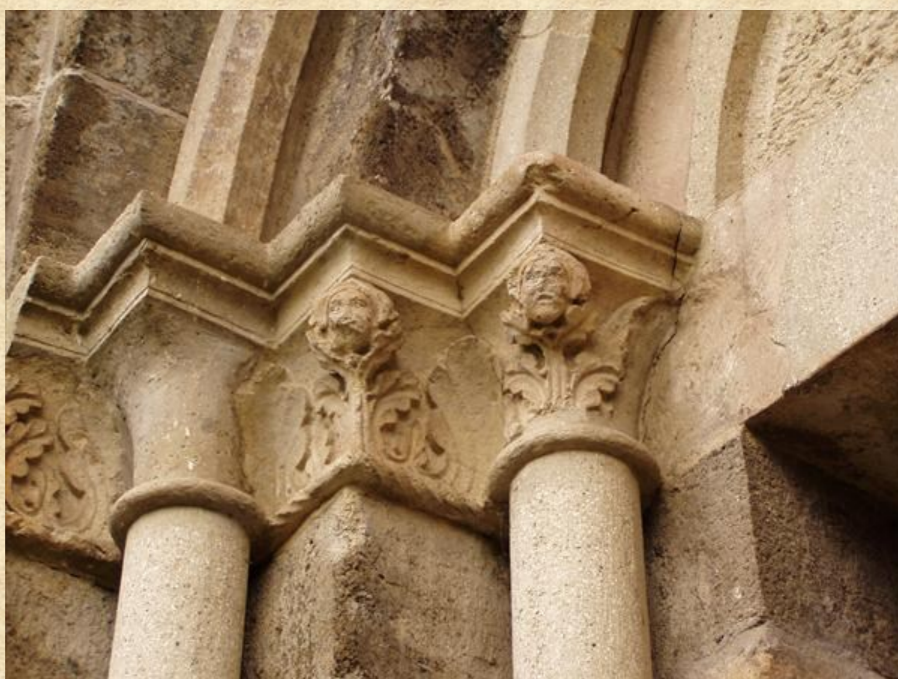
A déli kapu palmettás-emberfejes oszlopfői. A kapu jellegzetesen román kori, ún. bélletes kapu.